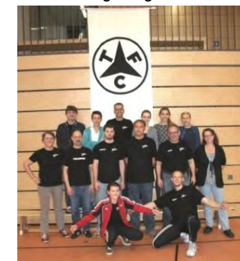
Gruppenbild der TFC-Helfer nach dem Abbau.

(Ergebnisdokumentation hier – mehr Fotos z.B. Siegerehrungen hier )